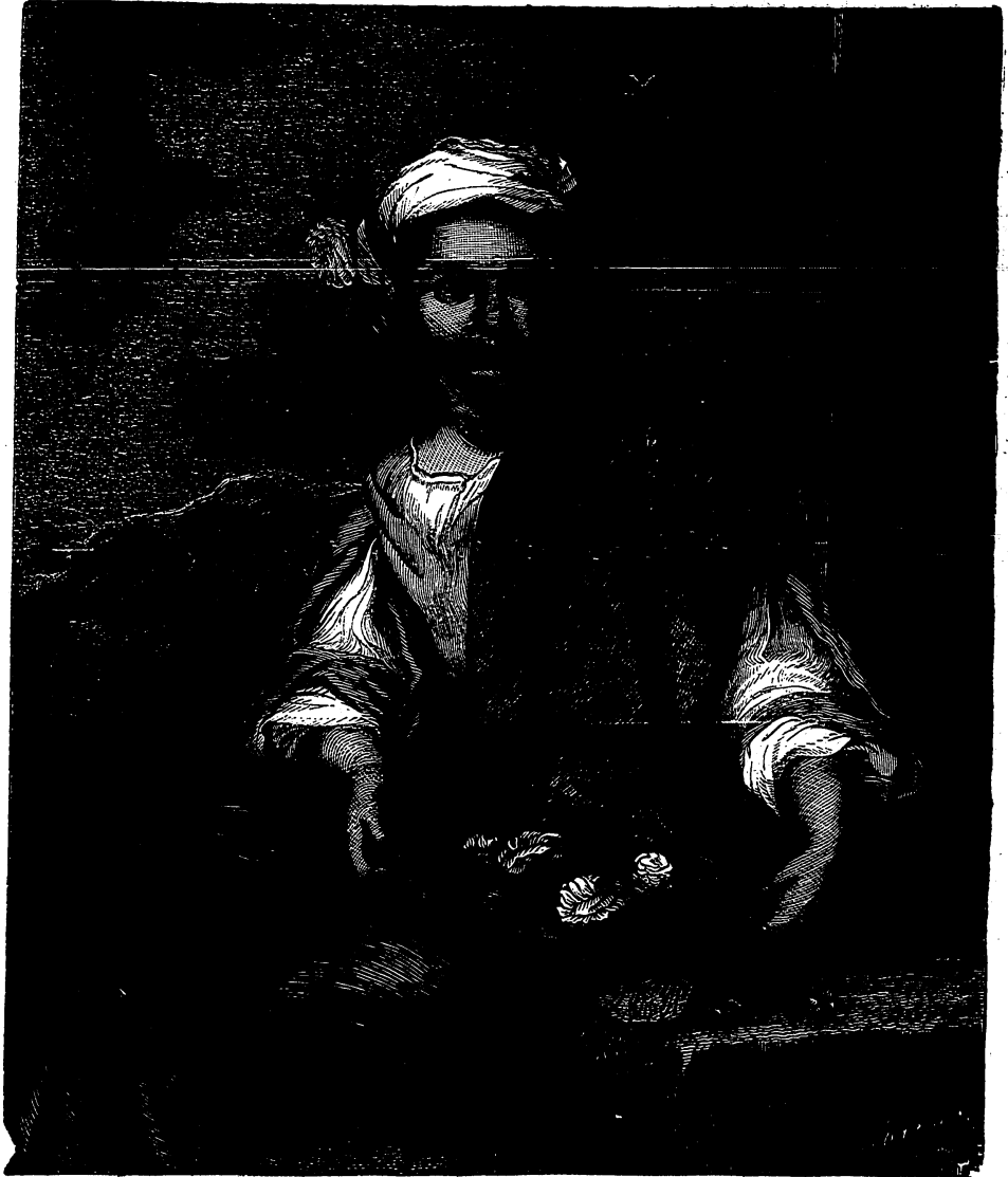
Jóven morisca.—Cuadro de Murillo.

Además de sus composiciones combinadas, los mas célebres pintores nos han legado obras que podemos llamar casuales, y en las cuales no han tenido mas intención que la de reproducir el aspecto de un paisaje ó de una fisonomía que acaso llegó á fijar sus miradas. Con el objeto de hallarse prevenidos para estos encuentros fortuitos, llevaban algunos siempre consigo unas tabillas destinadas á recibir el primer borrador de todo lo que el arte debía traducir despues. La escuela flamenca suministra abundantes estudios de este género. Aun cuando el pin'or no haya imaginado consignar sus ideas en semejantes obras, se