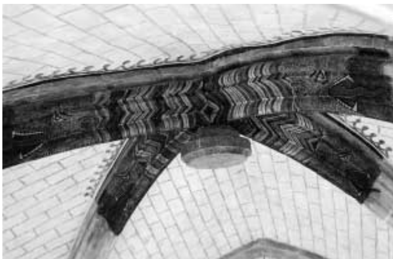
2. Detalle de las cabezas monstruosas que decoran los nervios.

Las cabezas monstruosas responden al tipo repetido en época gótica. Ornamentan por parejas cada nervio, de modo que en cada cara del nervio puede verse en su totalidad una de ellas, que mira hacia el exterior de la bóveda. En total, por tanto, se realizaron ocho cabezas, desigualmente conservadas. Se reconocen a la perfección las grandes fauces abiertas, con sus dientes (destacados los colmillos) y su larga lengua roja ondulante. Los ojos, sus cejas y las grandes orejas son los otros dos elementos reconocibles. Por detrás de las orejas y de la melena sigue una decoración en forma de cabrios, constituida por cintas de colores