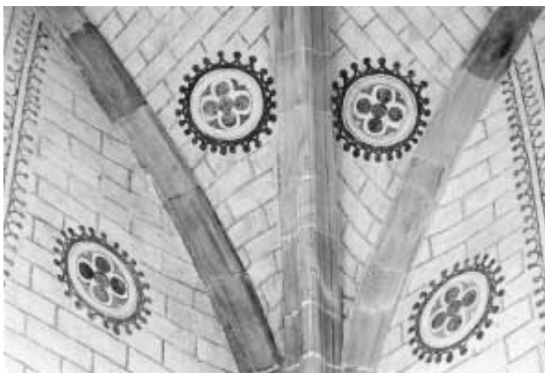
3. Detalle de la ubicación de los óculos.

Los óculos están constituidos por la yuxtaposición de cinco circunferencias negras enmarcadas por un cuadrilóbulo blanco dentro de un círculo blanco adornado interiormente por triángulos curvilíneos rojos. También los óculos están envueltos en una cenefa roja angrelada con remates en circulitos igualmente rojos, en todo similar -salvo en el color- a la que hemos descrito en los nervios. Existen ocho óculos en los arranques de los plementos de la bóveda y seis más que se disponen por parejas en la parte alta de los muros, por encima de los capiteles, a los lados de los recuadros con cenefas o del ventanal circular -óculo propiamente dicho- del lado meridional.