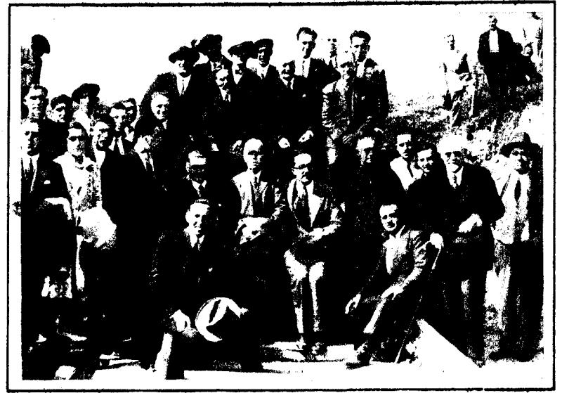
Ciudad de Ebro (Burgos). — Las autoridades de Santander y Burgos reunidas en el punto donde están detenidas las obras del ferrocarril Santander-Mediterráneo y donde el pasado domingo se celebró una asamblea para tratar de la continuación de las obras.