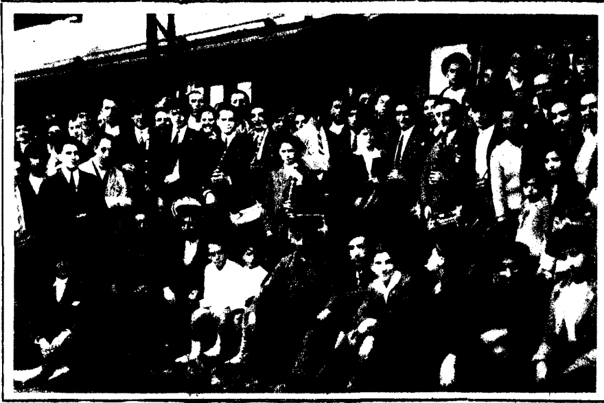
Miranda de Ebro (Burgos). — Los txistularis de Vizcaya que acompañan a los alcaldes de las provincias vasco-navarras que se han reunido en esta estación para tomar el tren especial que les condujo a Madrid para entregar el Estatuto Vasco-Navarro al Jefe del Gobierno.