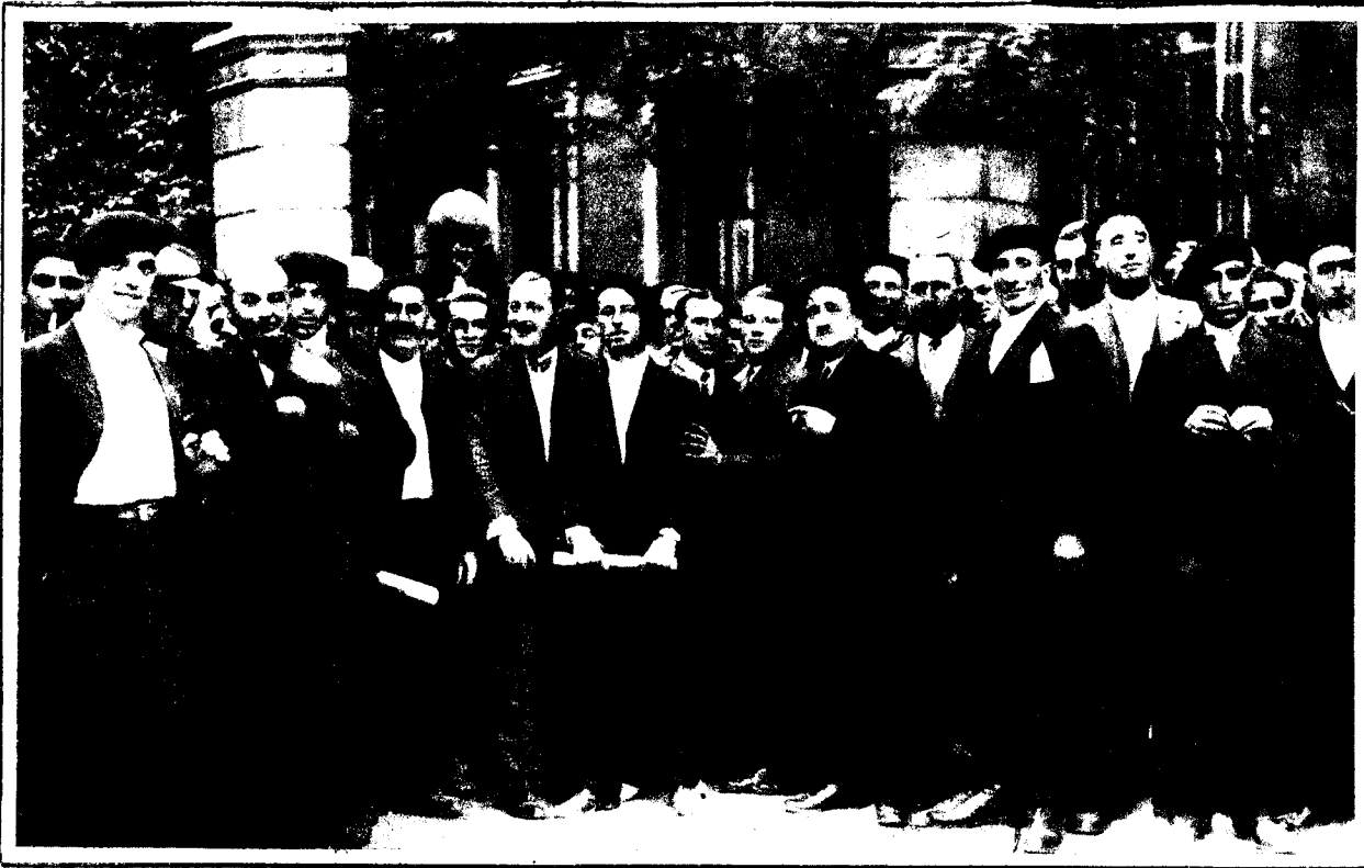
Madrid. — Los alcaldes portadores del Estatuto Vasco-Navarro, saliendo de la Presidencia después de haber entregado dicho Estatuto al Presidente del Consejo.