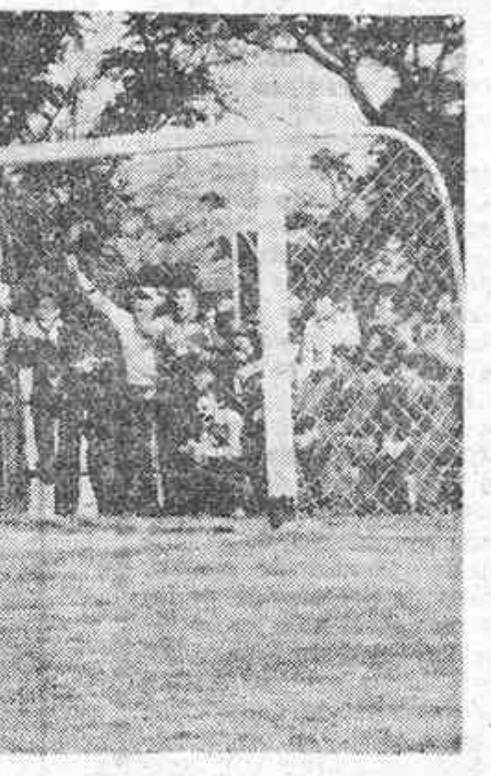
Uno de los goles del partido, todos ellos de excelente factura.

Carlos y Salvador, goleadores por partida doble